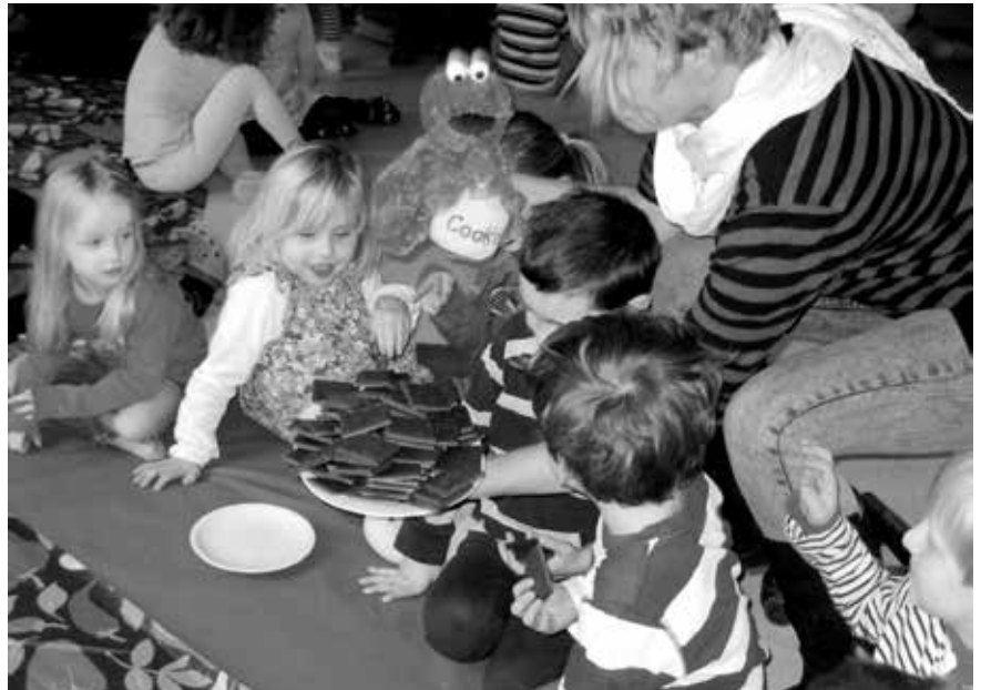
Riesenfreude in den Kitas des Paritätischen Hannovers über die süße Keksspende.

Die Firma Bahlsen reagierte großzügig auf den „Erpressungsversuch“ und versprach, nach der Rückgabe des goldenen Firmensymbols 52.000 Packungen Leibniz-Kekse an Kinder- und Jugendhilfeeinrichtungen zu verschenken. Für jede der 52 Zacken des Kekses sollten 1.000 Pakete gespendet werden. Über die Internetseite von Bahlsen bewarben sich innerhalb weniger Tage über 1.400 Organisationen um eine solche Keksspende. Darunter auch die Gemeinnützige Gesellschaft für paritätische Sozialarbeit (GGPS) Hanno-