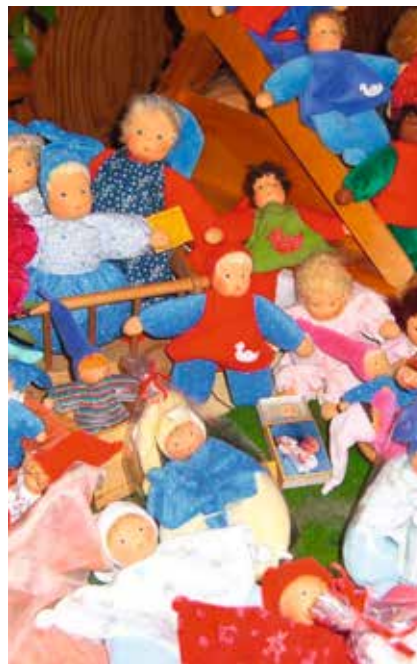
Bunte gebastelte Puppen für einen Basar des Waldorfkinder-garten am Maschsee e. V.

Um eine hohe Qualität der pädagogischen Arbeit gewährleisten zu können, gehört es zum Ziel des Vereins, dass alle fest angestellten pädagogischen Fachkräfte die Zusatzqualifikation der Waldorfpädagogik erwerben und sich darüber hinaus laufend fortbilden, natürlich auch zum Thema Inklusion. Es ist für uns nichts Außergewöhnliches, Kinder aus anderen Kulturkreisen in unsere Kindergartengruppen aufzunehmen. Eine andere Sprache oder Religion ist uns willkommen, um gleichberechtigte Betreuung zu gewährleisten.