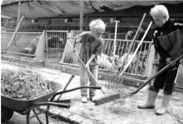
Alle packen mit an: Kinder helfen auf dem Internationalen Schulbauernhof gGmbH Hardeggen bei der Stallarbeit mit.

Unter der Prämisse Landwirtschaft erleben – Lebensmittel wertschätzen – Zukunft nachhaltig gestalten, engagiert sich die paritätische Mitgliedsorganisation Internationaler Schulbauernhof gGmbH Hardeggen für Bildung für Nachhaltige Entwicklung (BNE). Kinder, Jugendliche und Erwachsene können hier Tiere versorgen, bei der Feld- und Gartenarbeit mithelfen, Lebensmittel erzeugen und Speisen zubereiten. Nach Absprache