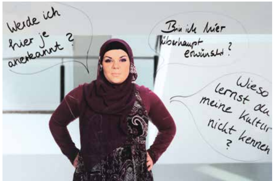
„Werde ich hier je anerkannt?“ – eine der Fragen, die sich die Jugendlichen gestellt haben und die in der Ausstellung künstlerisch umgesetzt wurden.