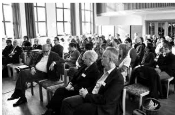
Interessierte Gäste verfolgen die Vorträge.

Zum 2. Fachtag des Arbeitskreises Sprachheilarbeit mit dem Fachberatungsteam Hören und Sprache im Niedersächsischen Landesamt für Soziales, Jugend und Familie (Landessozialamt LS) am 05. März 2013 in Langenhagen fanden sich wieder etwa 60 interessierte Mitarbeiter/-innen aus ganz Niedersachsen im