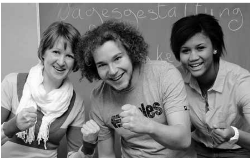
Spaß beim gemeinsamen Lernen: Schüler der Berufsbildenden Schulen des Albert-Schweitzer-Familienwerks e.V.