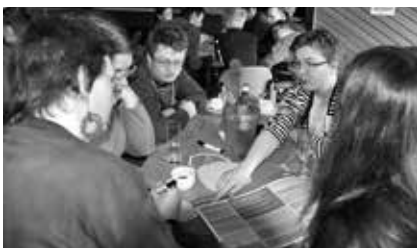
Mittelpunkt vieler Gespräche auf dem Zukunftstag: Das neue, farbig gestaltete Leitbild der GPS Wilhelmshaven.

Ein lichter großer Saal, 50 farbig eingedeckte Tische, bunte Luftballons an der Decke: Eine lockere, fröhliche Umgebung empfing die knapp 250 Teilnehmer beim Zukunftstag der Gemeinnützigen Gesellschaft für Paritätische Sozialarbeit (GPS) mbH Wil-