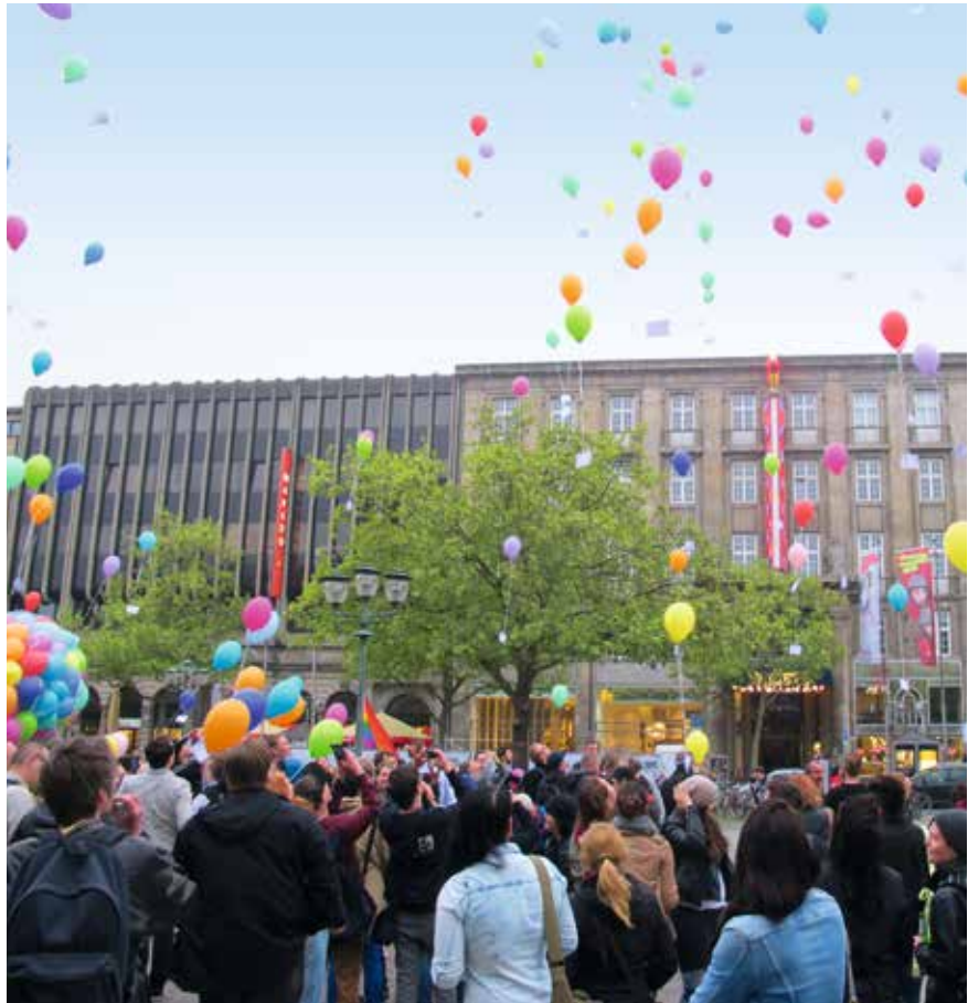
Um Punkt 19 Uhr stiegen die bunten Ballons in den Himmel von Hannover auf.

Es war ein buntes Bild, das sich am 17.5.2013 auf dem Opernplatz in Hannover bot: Auf Einladung des Lesben- und Schwulenverbands (LSVD) Niedersachsen-Bremen e.V. hatten sich rund 100 Menschen eingefunden, um am Internationalen Tag gegen Homophobie ein Zeichen gegen jegliche Form von Anfeindungen und Diskriminierungen gegen homosexuelle Menschen zu setzen. Zu diesem Zweck hatte der LSVD mehrere Hundert bunter Luftballons zur Verfügung gestellt, an die alle Interessierten eine Karte mit ihrer ganz eigenen Gedanken zum Thema schrieben und sie dann gemeinsam um Punkt 19 Uhr auf die Reise schickten.