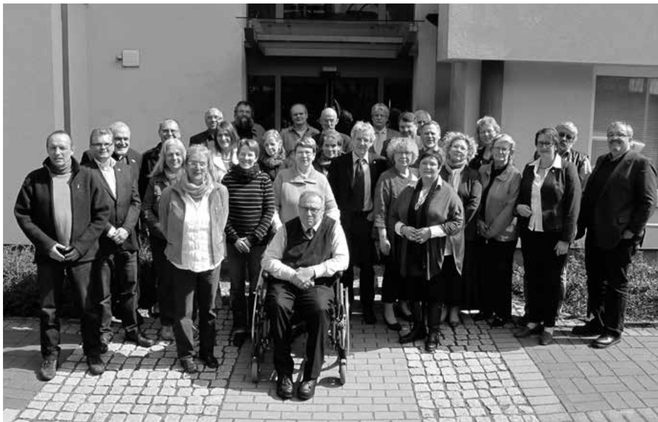
Die Vorsitzenden der Kreisverbands-Beiräte und der Vorstand des Paritätischen Wohlfahrtsverbands Niedersachsen e.V. auf ihrer turnusgemäßen gemeinsamen Konferenz am Sonnabend, 20. April 2013 in Hannover.

Genug geredet, es wird Zeit zu handeln: Die Vorsitzenden der Kreisverbands-Beiräte des Paritätischen Wohlfahrtsverbands Niedersachsen e.V. haben auf ihrer turnusgemäßen gemeinsamen Konferenz am Sonnabend, 20. April 2013 in Hannover deutliche Worte gefunden und ein längst überfälliges, schlüssiges Konzept zur Daseinsvorsorge speziell im ländlichen Raum gefordert. Gerade ein Flächenland wie Niedersachsen braucht dringend Handlungskonzepte, um die gesellschaftlichen Herausforderungen des demografischen Wandels