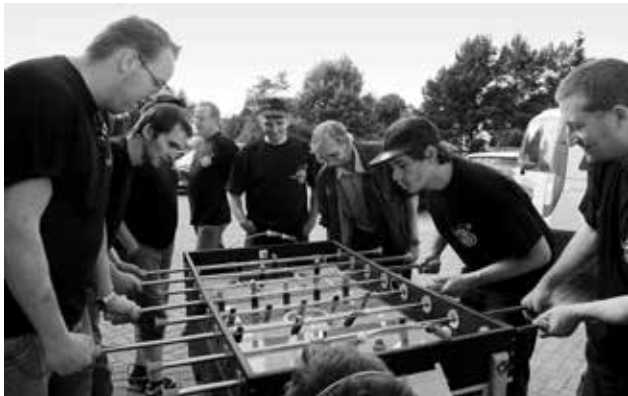
Im Mittelpunkt des Geschehens: der inklusiv gestaltete „Joks-Kicker“.

Teilnehmer/-innenbeteiligung darstellt. Dieses würde jedoch diesen Rahmen sprengen, sodass an dieser Stelle der Fokus auf zwei besonderen Projekten aus dem Jahr 2012 liegt.