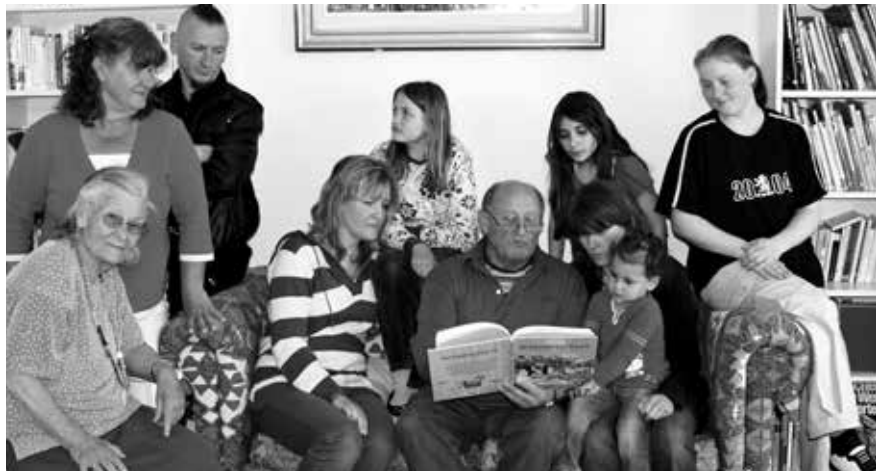
Jung und Alt beim gemeinsamen Vorlesen in der „Schmökerei“ im SOS-Mütterzentrum.

Viele Kinder nutzen das gemeinsame Essen, Basteln und Reden mit den älteren Menschen wie einen kleinen „Urlaub vom Alltag“. In familiärer Atmosphäre erfahren sie eine Ruhe, wie sie sie im ausschließlichen Beisammensein mit anderen Kindern nicht erleben. Die älteren Menschen schenken ihren Alltagsorgen und Schulerlebnissen Gehör. Den Kindern wird zugehört und sie werden ernst genommen. Außerdem erfahren die alten Menschen gleichzeitig, dass sie eine wichtige (Zuhörer-)Rolle einnehmen.