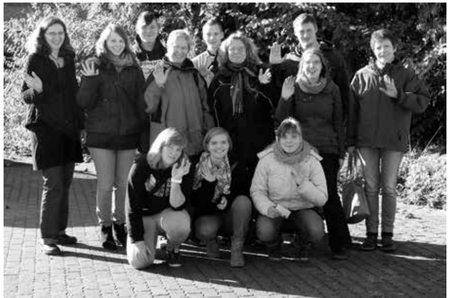
Gruppenbild der Teilnehmer/-innen an der inklusiven Jugendleiter/-innen-Ausbildung.

Zum Schluss des Lehrgangs gaben alle Teilnehmer/-innen sehr positive Rückmeldungen an die beiden Kursleiterinnen. Es sei eine gute Balance zwischen Anforderungen und Spaß gelungen. Letzteres wurde insbesondere auf die geselligen Abende zurückgeführt, was noch einmal den Sinn unterstreicht, warum man gemeinsam wegfahren sollte. Die Hälfte der Teilnehmer/-innen der Jugendleiter/-innen-Ausbildung bringt sich nun aktiv ins Vereinsgeschehen ein und arbei-