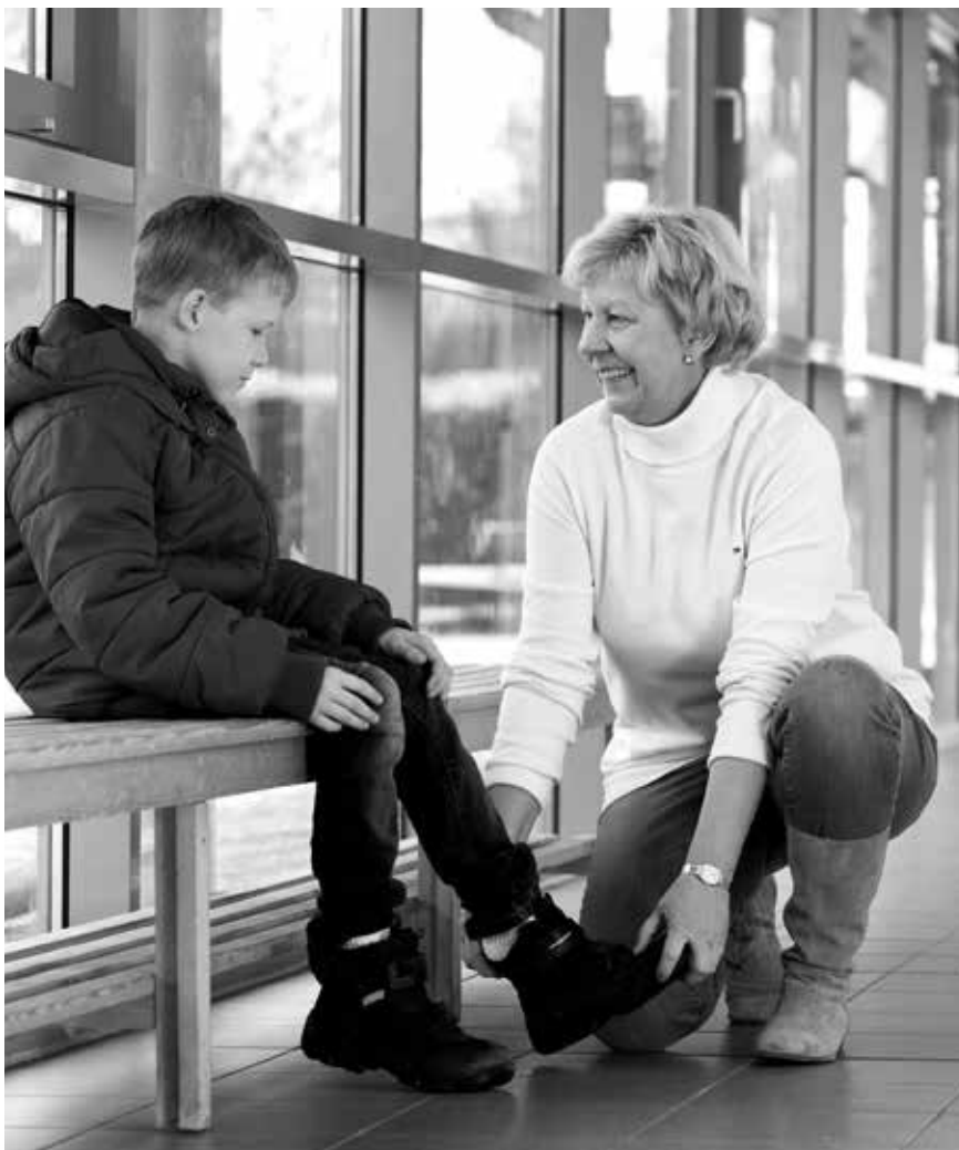
Die Aufgaben einer Schulassistentin sind abhängig vom Krankheitsbild des Schülers – bei einer körperlichen Beeinträchtigung gehört zum Beispiel Hilfe beim Ankleiden dazu.