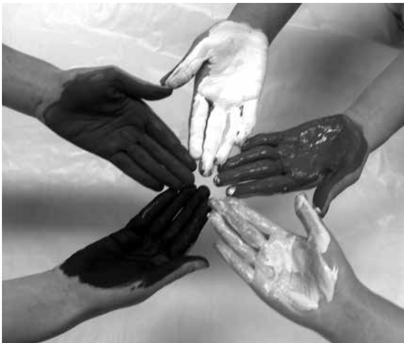
Bunte Hände von Teilnehmerinnen und Teilnehmern der internationalen Begegnung 2008.

Menschen mit Behinderungen anbietet. Mit dabei ist auch die Lebenshilfe Seesen/Bad Gandersheim: Hier wird eine Gruppe aus der Einrichtung Kurparkschule an der internationalen Begegnung teilnehmen. Die Kurparkschule ist eine anerkannte teilstationäre Einrichtung zur schulischen Förderung, Bildung und Betreuung von geistig behinderten Kindern, Jugendlichen und jungen Erwachsenen. Über die Kurparkschule wurde auch ein zu-