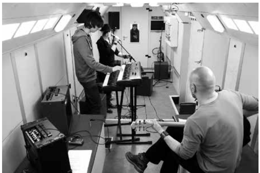
Die Band „Pirates of Doom“ (Keyboard, Gesang, Gitarre) erhält im Musik-in-Liner Anregungen und Coaching zu ihrem bestehenden eigenen Programm.